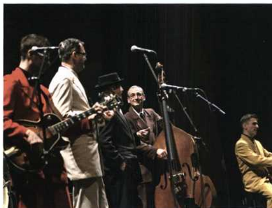
Stimmungsvolle Musik bei der 120 Jahr Feier