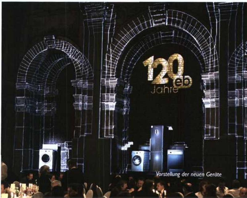
Vorstellung der neuen Geräte