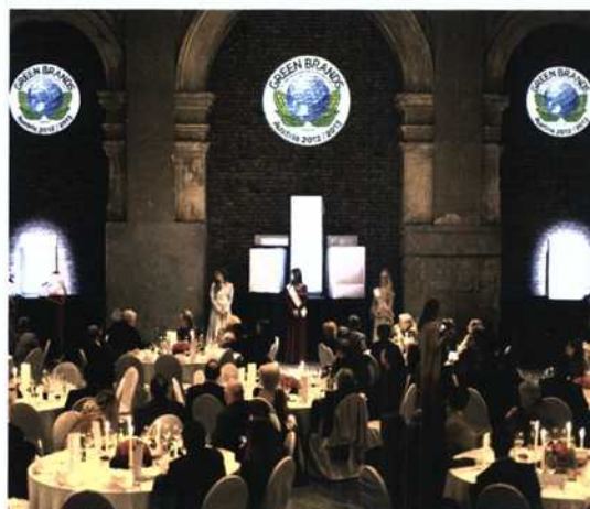
Präsentation der neuen Geräte durch die Missen